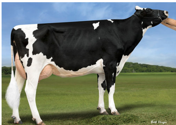
FAIRMONT DELTA RHONDA DAM